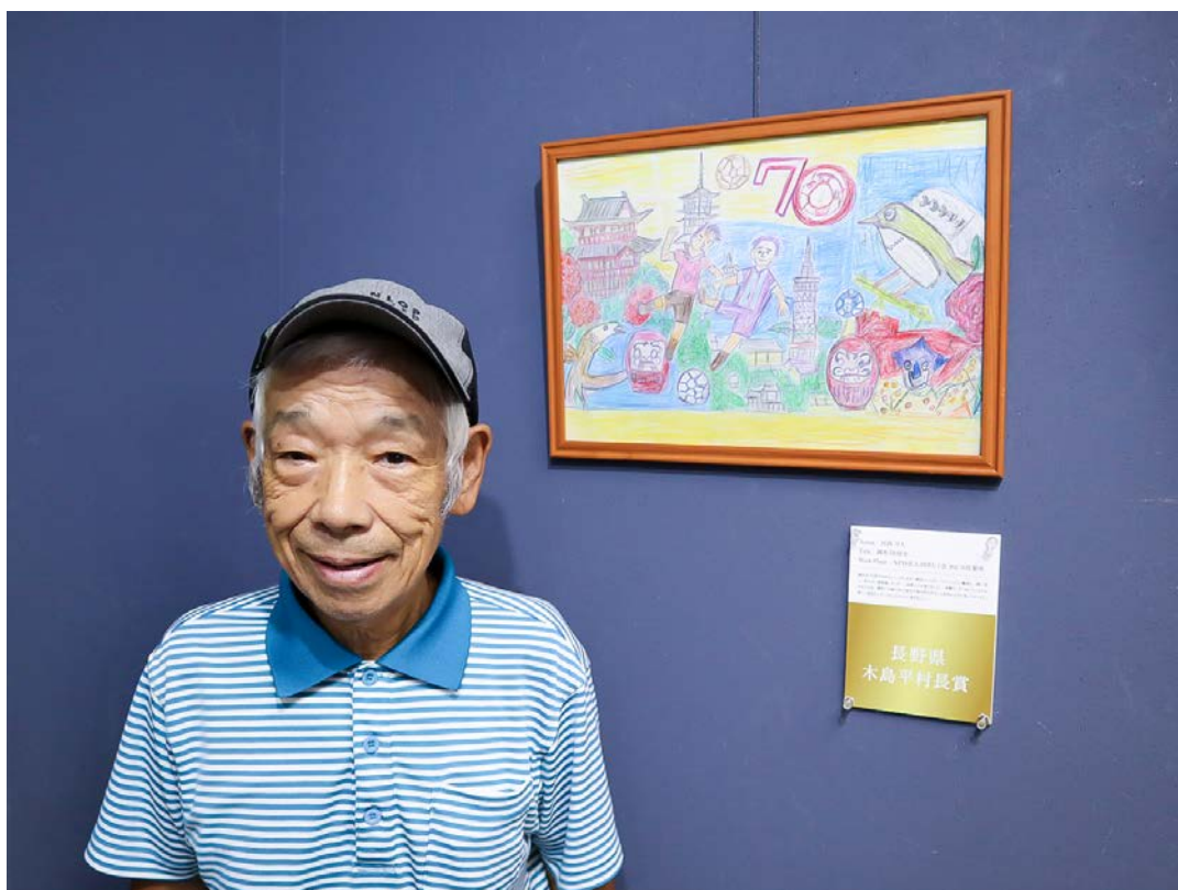
令和7年10月3日（金）パラアート展会場にて