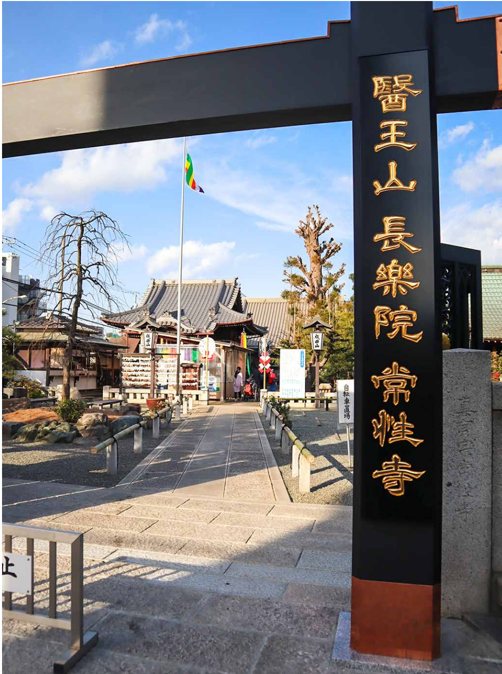
令和5年1月 常性寺にて